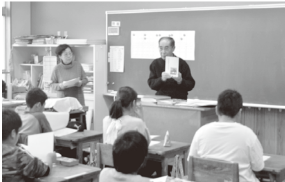
三芳小学校福祉体験教室にて毎年点字の学習会を行う

高度情報化社会と言われる現在、視覚的な情報があふれています。こうした社会の変容は、視覚障が