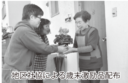
地区社協による歳末激励品配布