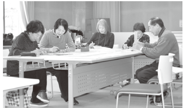
点訳作業 「咸宜園」の資料3冊を点訳し、大分市点字図書館むくどり文庫へ。