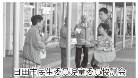
日田市民生委員児童委員協議会