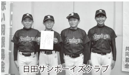
日田サンボーイズクラブ