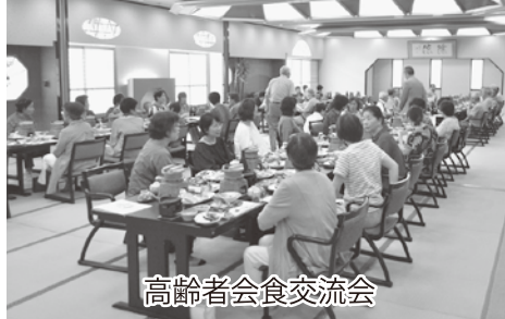
高齢者会食交流会