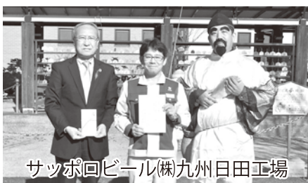
サッポロビール(株)九州日田工場