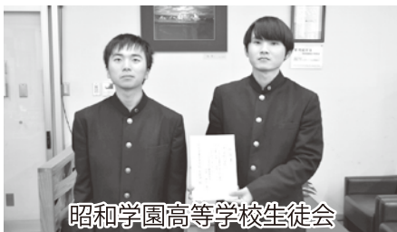
昭和学園高等学校生徒会