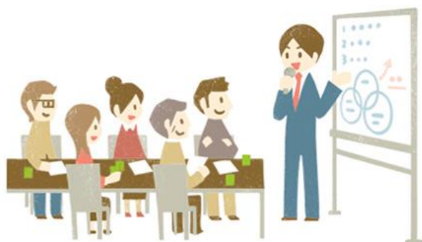
講演会の開催に必要な費用