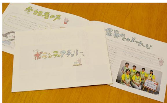
活動の普及・啓発パンフレットの作成費用