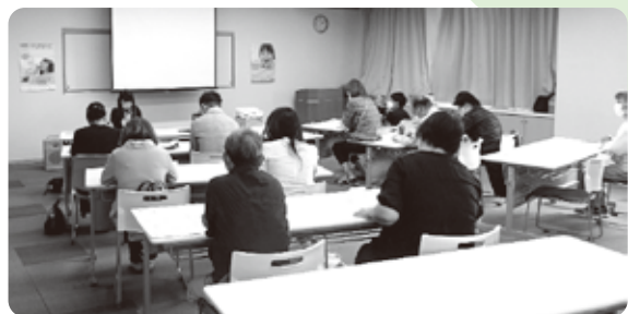
↑養育里親の説明会も行っています