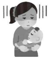
金銭管理が苦手で子どもにお金が回らない

まずは、早い段階での相談が問題を解決する上での第一歩であることは変わりありません。お気軽にご相談ください。