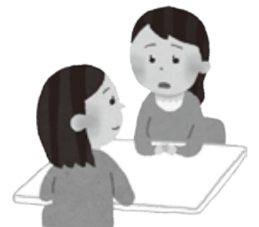
悩み事や困りごとは、誰かに話すことで整理されて楽になることも…