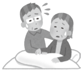
日々、目の前の仕事や介護、家事をやることで精一杯…