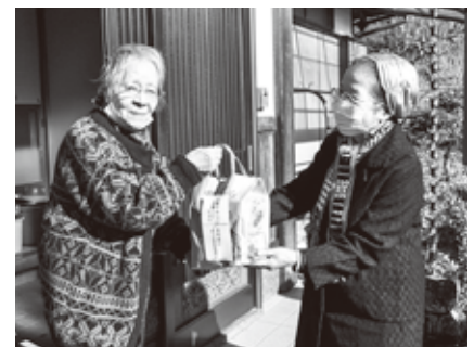
地区社協による歳末激励品配布