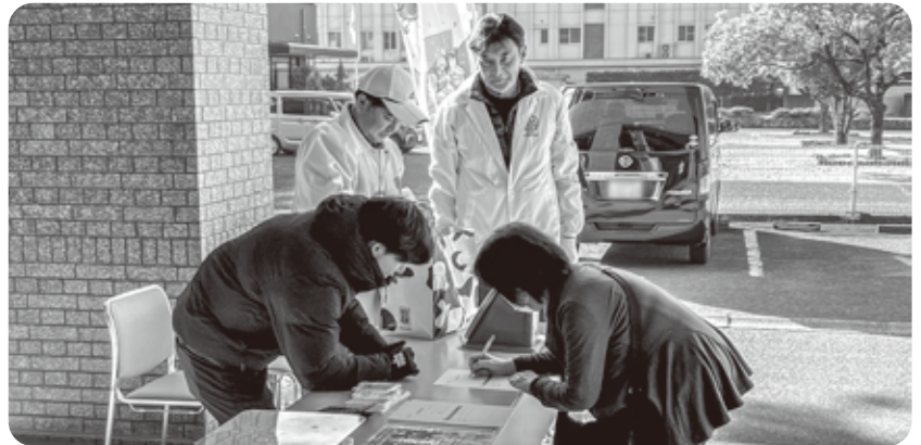
当日はたくさんの方が寄付に訪れました

集まった品物は、12月24日(日)に「フードパントリー」を実施し、多くの方へお渡ししました。ご支援頂きました皆様方の想いも届けることができました。