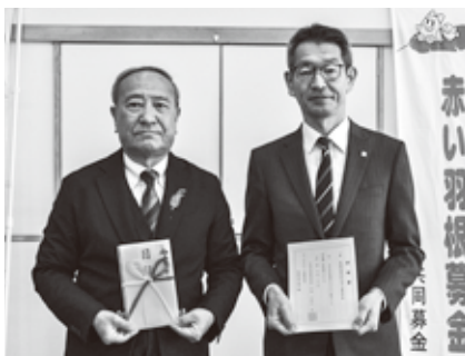
サッポロビール(株)九州日田工場

12月中旬から年末にかけて、市内20地区社協では、地域の要支援者や児童を対象にした「歳末たすけあい事業」を実施しました。