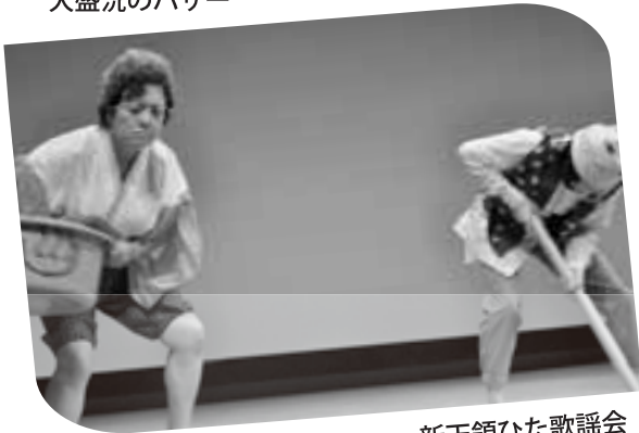
新天領ひた歌謡会