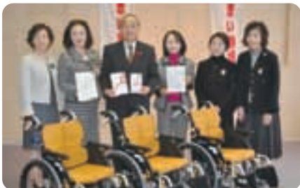
● 国際ソロプチミスト日田 車イス3台 社会福祉事業へ