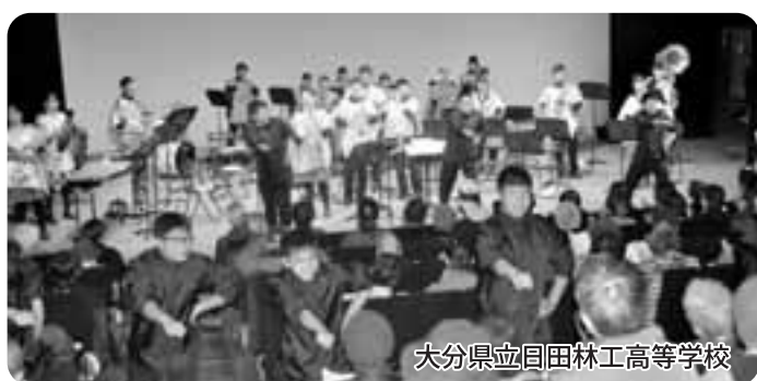
大分県立回田林工高等学校