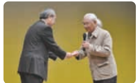
● 新天領ひた歌謡会 10万円 社会福祉事業へ