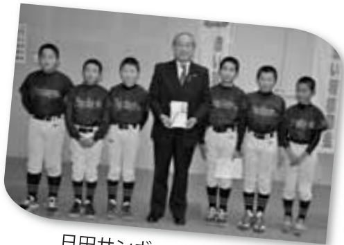
日田サンボーイズクラブ