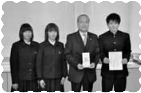
昭和学校高等学生徒会