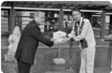
サッポロビール(株)九州日田工場