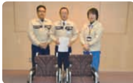
● TDK三隈川工場 職員労働組合 車イス2台 社会福祉事業へ