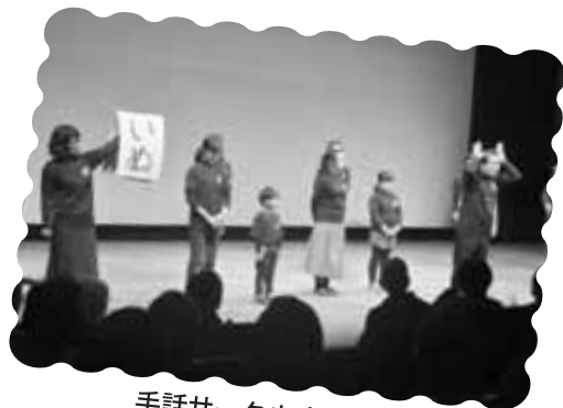
手話サークル あさぎり