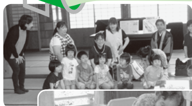
なかつえ保育園児との 七夕まつり交流会