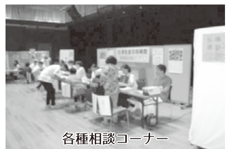
各種相談コーナー