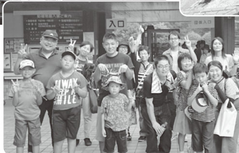
社会見学（福岡市動植物園）