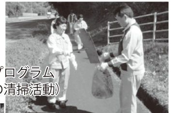
アダプトプログラム (周辺国道の清掃活動)