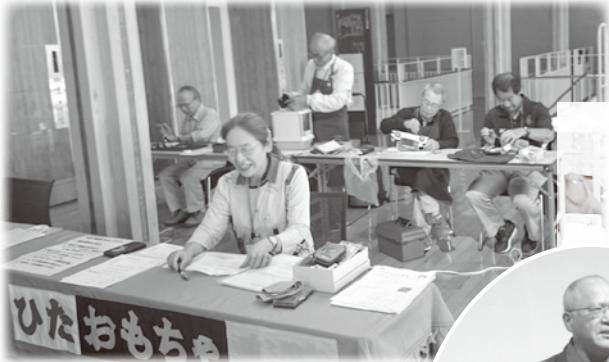
ひたおもちゃ病院が開設後初参加 壊れたおもちゃを修繕