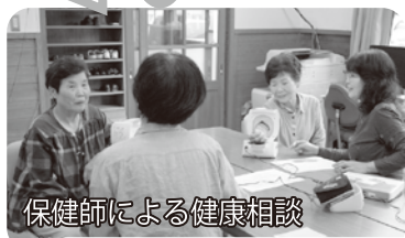
保健師による健康相談