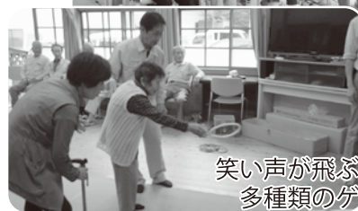
笑い声が飛ぶ 多種類のゲーム