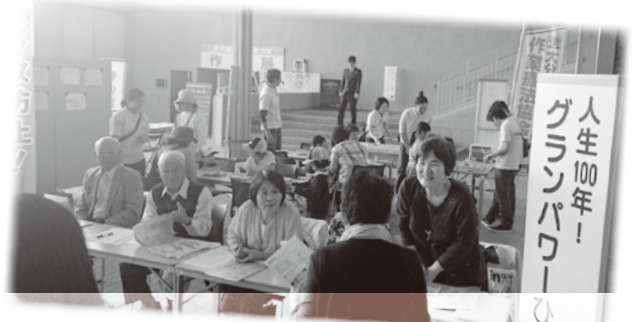
シルバー人材センター グランパワーひろば