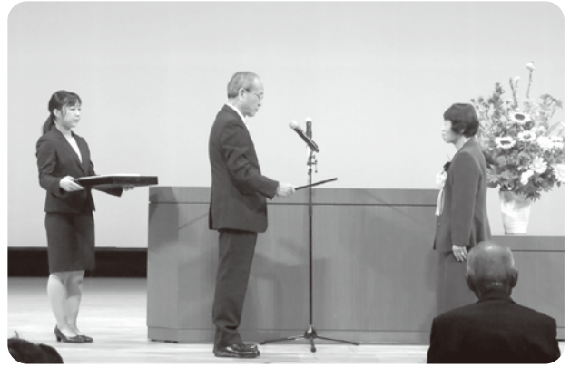
社会福祉事業協力団体 月出山井戸端交流サロン（月出町）

また、中央公園では、市内福祉事業所等による福祉生産品の販売や焼きそば等の模擬店で賑わいました。