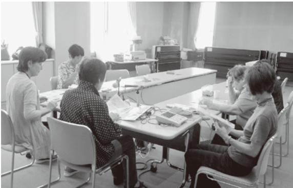
音訳作業中 分かりやすく丁寧に読み上げます。

また、テープを送るだけでなく年に数回、登録者との交流会を開いて、知りたい情報や要望について意見交換をしています。