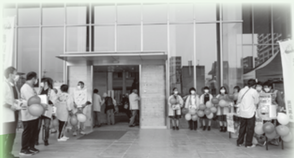
赤い羽根共同募金運動の開始(10月1日から) のPRのため、街頭募金を実施