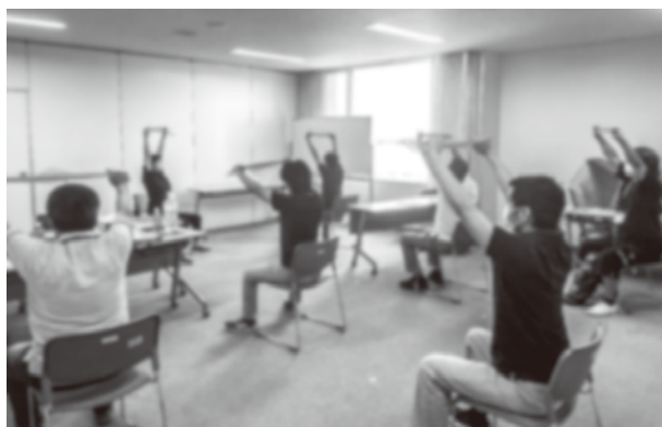
健康体操で体力づくりを体験