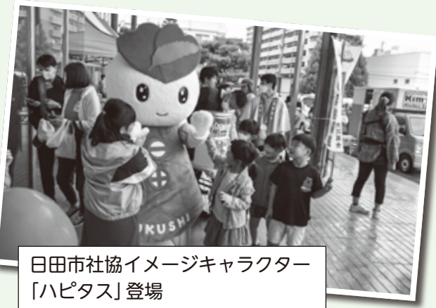
日田市社協イメージキャラクター 「ハピタス」登場