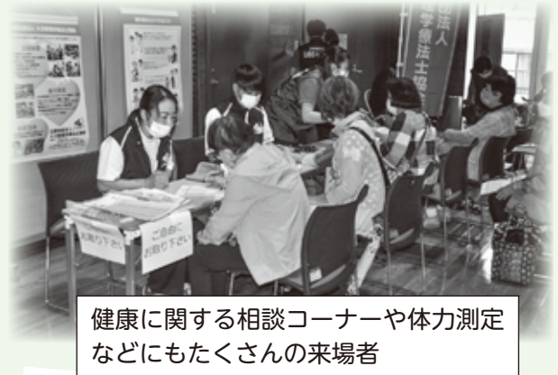
健康に関する相談コーナーや体力測定 などにもたくさんの来場者