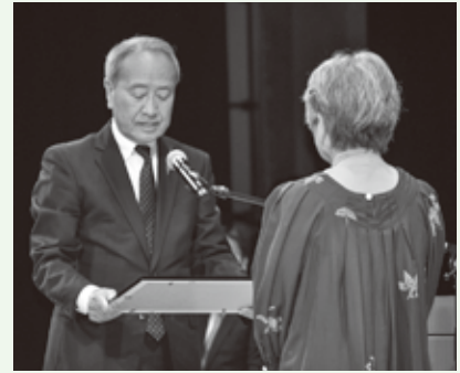
受賞された皆様、 おめでとうございます。

また、中央公園は、市内福祉事業所等による福祉生製品の販売や焼きそば等の模擬店で賑わいました。