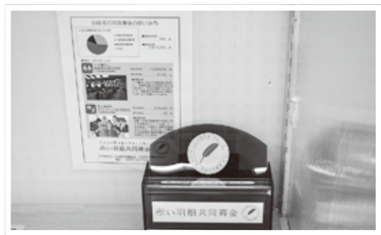
設置している募金箱