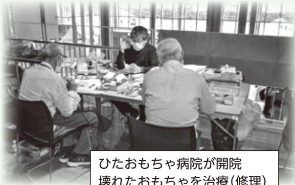
ひたおもちゃ病院が開院 壊れたおもちゃを治療(修理)