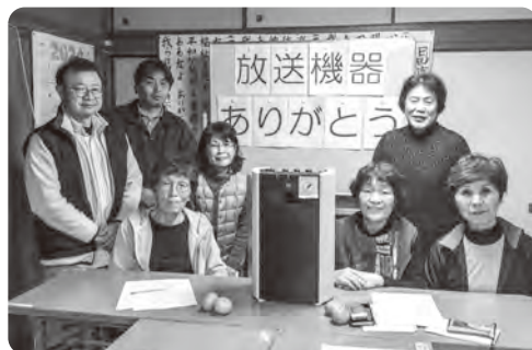
特定非営利活動法人 日田市レクリエーション協会