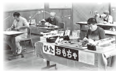
おもちゃ病院も開院します

☆福祉・健康・模擬店ひろば (パトリア日田屋外・中央公園) 10:00～15:00