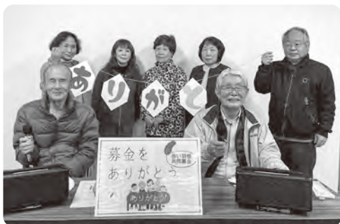
中津江地区社会福祉協議会