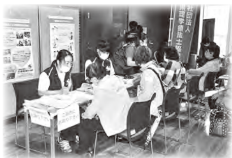
各種相談コーナーを設置