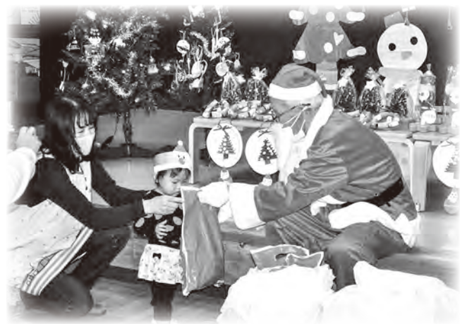
子育て世帯への支援活動へ

日田市内でご協力いただきました募金は、各地域の「地区社会福祉協議会」が行う、歳末たすけあい事業に充てられ、誰もが孤立することなく、安心して新年を迎えられるよう様々な活動が行われます。