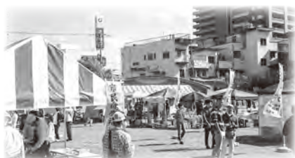
模擬店ひろば中央公園