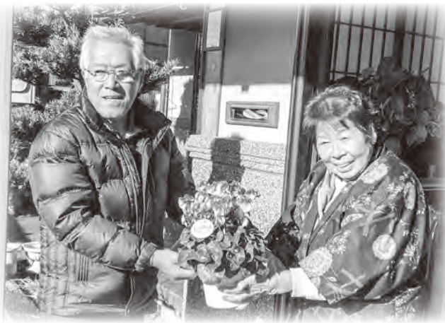
地域の見守り活動へ