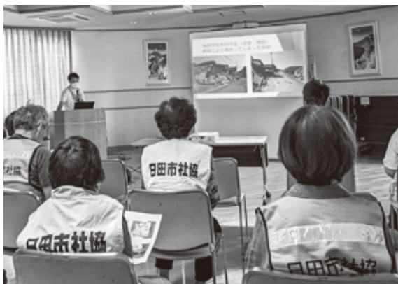
講義では能登地震での活動を説明

令和6年6月9日(日)災害ボランティアセンターの運営訓練を日田市と共催で、実施しました。当日は雨予報でしたが太陽が時折顔を出す訓練日和となりました。