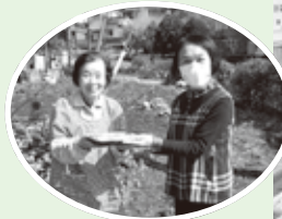
お弁当と笑顔をお届けします

一人暮らし高齢者や高齢者のみの世帯を対象に見守りや食生活の改善を目的に心のこもったお弁当と手紙を届けています。