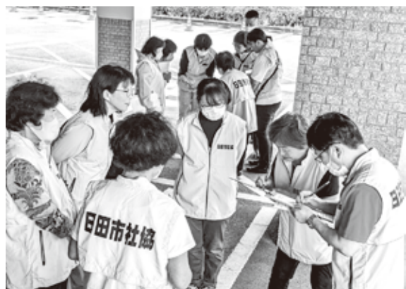
素早くグループ名簿を記入する参加者

当日は災害ボランティアネットワーク連絡協議会の会員を中心に23名の方が参加されました。まず、石川県能登半島地震災害ボランティアの現状について講義を行い、その後は、2グループに分かれて被災者とボランティアをつなぐ「マッチング」体験、災害が起きた際に使用する資機材の実働体験をしました。