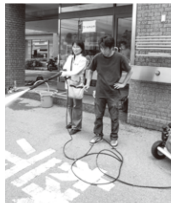
ドローンだけでなく、様々な機材を体験