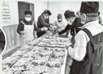
役員の皆さんでお弁当作り