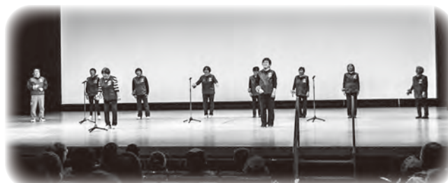
高瀬地区民生委員 〜手話ソング〜