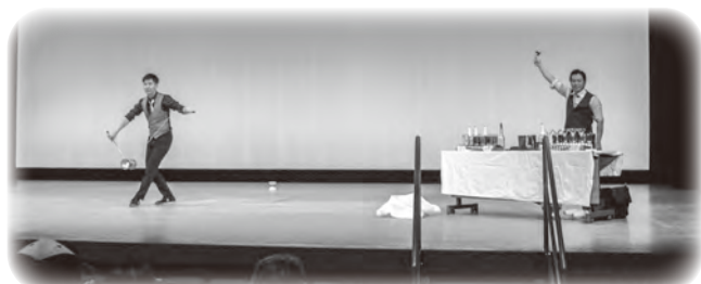
ジャグリング倶楽部ジュピター 〜フレア&ジャグリングショー〜