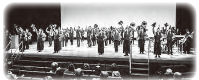
藤蔭高等学校吹奏楽部 ～藤蔭カーニバル～