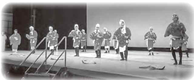
サンヒルズひたひょっとこ愛好会 ～ひょっとこ踊り～