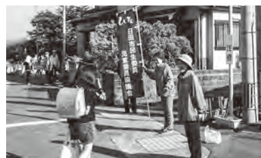
あいさつ運動の様子