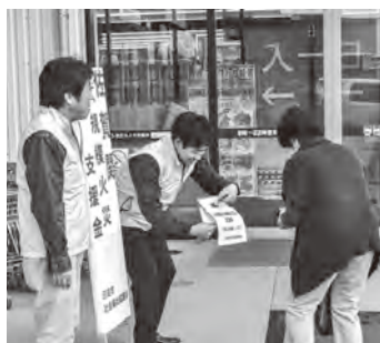
街頭募金活動の様子

大分市社会福祉協議会へ支援金を届けた際、被災地の災害ボランティアセンターの活動状況や、現場の声を聞かせていただきました。被災地の1日も早い復旧と復興を心よりお祈り申し上げます。