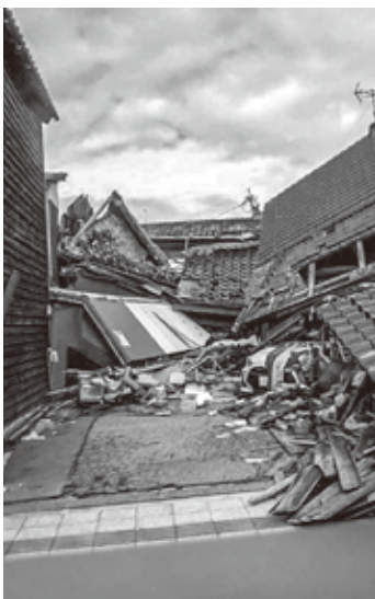
現地の映像は信じられない光景ばかりでした