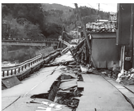
現地はインフラ整備と道路の復旧を優先しています

普段の生活に必要なものや、被災地の特産品などを購入して、思いを寄せていただくことも良いと思います。