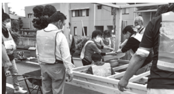
↑床下泥出し体験では、住民役を担う講師から、被災状況を伺う場面も…