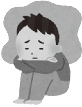
ひきこもり…は 怠けではない

内閣府は、ひきこもりについては、社会的自立に至っていないかどうかに着目し、「趣味の用事の時だけ外出する」「近所のコンビニ等には出かける」「自室からは出るが、家からは出ない」「自室からほとんど出ない」のいずれかに該当した人のうち、現在の状態となつて6か月以上かつ病気を理由としない方を「広義のひきこもり」と定義しています。