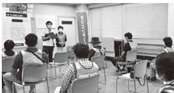
↑運営スタッフとして受付・オリエンテーション班ができる様に要点を体験